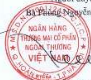
Phó Tổng Giám đốc